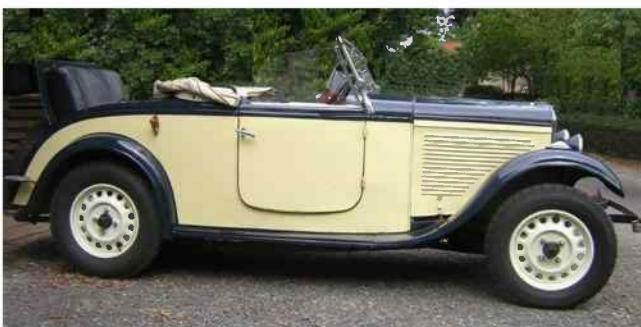
201 Roadster 1930

Un point important à ne pas oublier non plus, c'est le stock important de joints de culasse (et autres pièces) que Rémi tient à votre disposition pour vous dépanner (à prix d'ami ce qui ne gêne rien!).