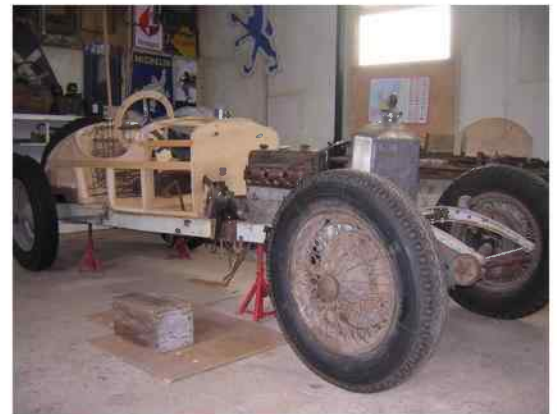
La STEYR en reconstruction